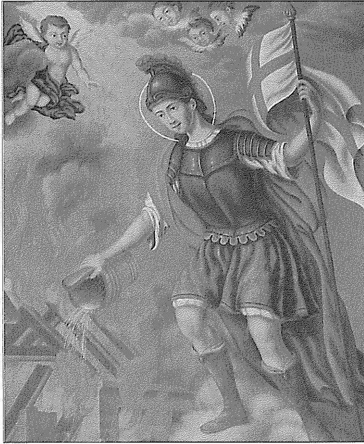
Ölbild des Heiligen Florian in der Pfarrkirche Obermeisling